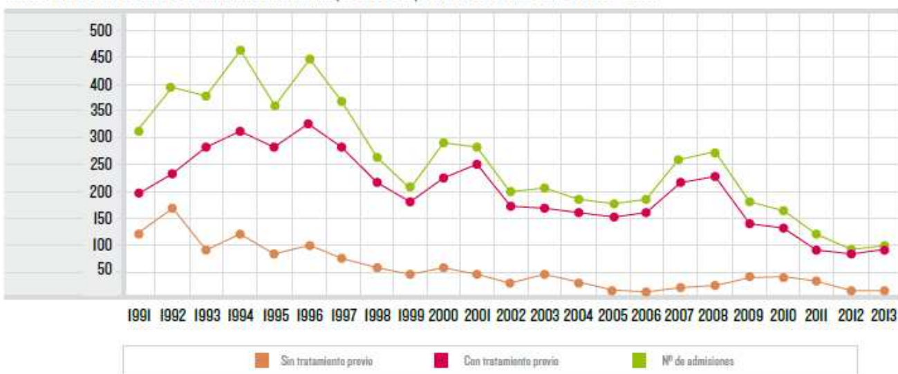
GRÁFICO 15. Evolución del número de admisiones a tratamiento por abuso o dependencia de heroína. Cantabria 1991 – 2013.

El número de admisiones a tratamiento por consumo de cocaína fue de 219 en 2013, lo que supone un aumento del 3,3% con respecto a 2009 y representa el 34,5% del total de admisiones registradas en 2013. Durante este periodo el número de admisiones a tratamiento por primera vez ha descendido y es prácticamente el mismo que el de las admisiones de pacientes que ya habían recibido tratamiento (Gráfico 16).