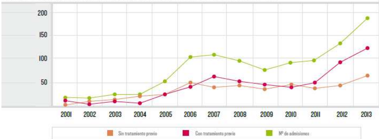
GRAFICO 17. Evolución del número de admisiones a tratamiento por abuso o dependencia del alcohol. Cantabria 2001 – 2013.

El número de admitidos a tratamiento por consumo de cannabis ha ido aumentando progresivamente, en el año 2013 fue de 80, lo que supone un aumento del 88% con respecto a los registrados en 2009 y representa el 13,2% del total de admisiones a tratamiento por consumo de drogas en 2013. El 88,6% son pacientes que han acudido por primera vez a tratamiento (Gráfico 18).